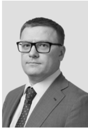
А.Л. Текслер, губернатор Челябинской области

В день рождения Челябинской области желаю вам, дорогие друзья, крепкого здоровья, счастья и взаимопонимания в семьях, мира и благополучия!